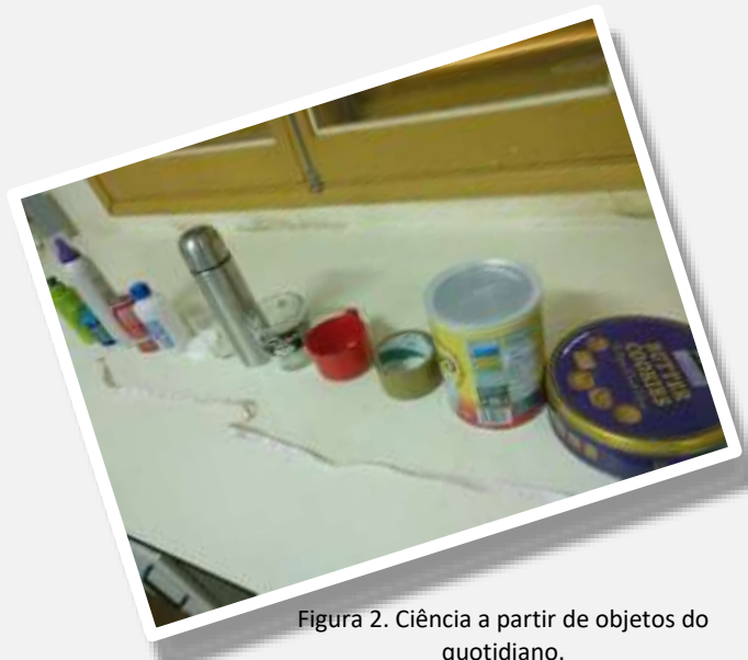
Figura 2. Ciência a partir de objetos do quotidiano.