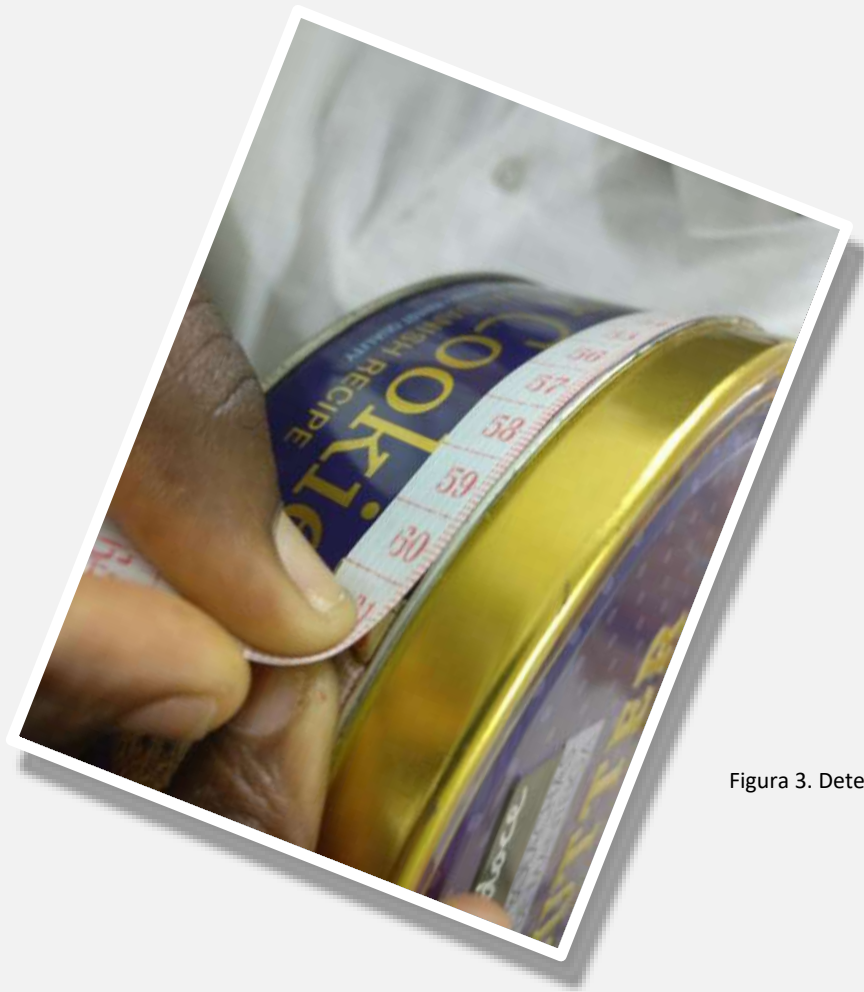
Figura 3. Determinação do perímetro.